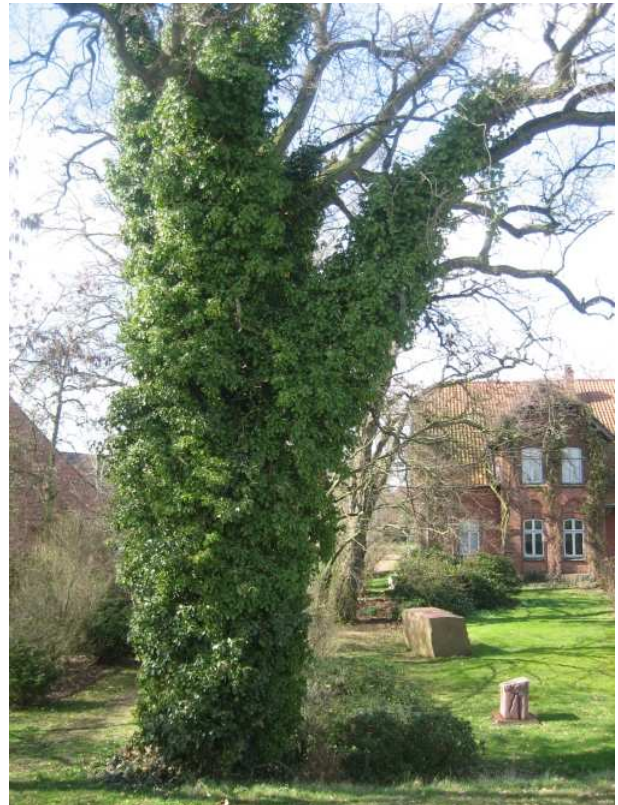
Alter Efeu an einer Stiel-Eiche im Skulpturengarten Damnitz, Lüchow-Dannenberg, vor dem Laubaustrieb

oder sägen Efeu in den Stadtwäldern und Grünanlagen heimlich ab. Diese unbefugte und strafbare 1 Variante des „Baumschutzes“ scheint in letzter Zeit in Hannover erheblich zugenommen zu haben, wird aber auch andernorts beobachtet. 2