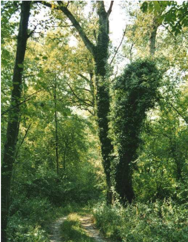
Hartholz-Auwald am Oberrhein bei Weisweil. Wegen der hier besonders reichen und alten Efeuvorkommen fanden am Oberrhein wichtige Untersuchungen zum Verhalten von Efeu in Wäldern statt.

den sich auch insgesamt keine Anhaltspunkte für ein erhöhtes Absterberisiko durch Efeubewuchs. Bei den mit Efeu bewachsenen Bäumen betrug der Anteil an abgestorbenen Bäumen nur etwa 7 Prozent (HOHLFELD 2001). Der Wert lag in der Größenordnung des Totholzanteils am gesamten Holzvorrat in diesem Wald (8,7 Prozent) (HOHL-