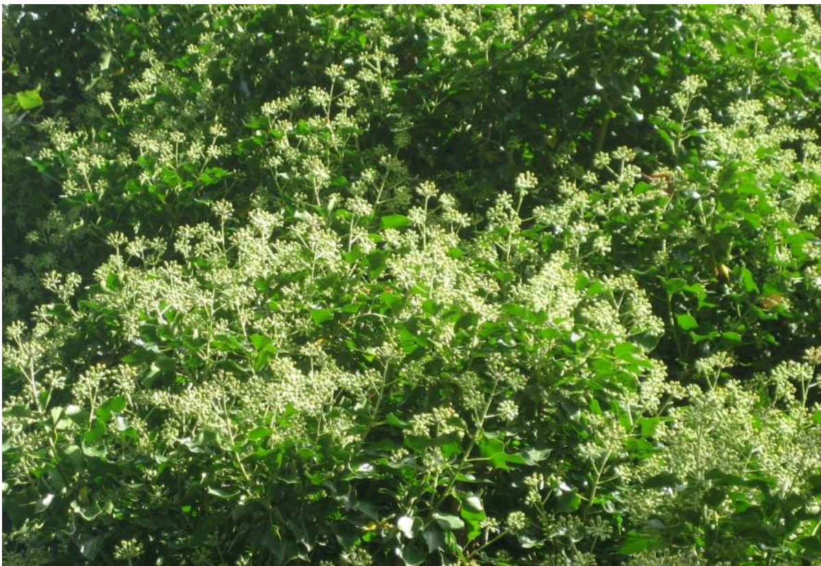
Alte Efeupflanze auf einer Birke kurz vor Öffnen der Blüten.