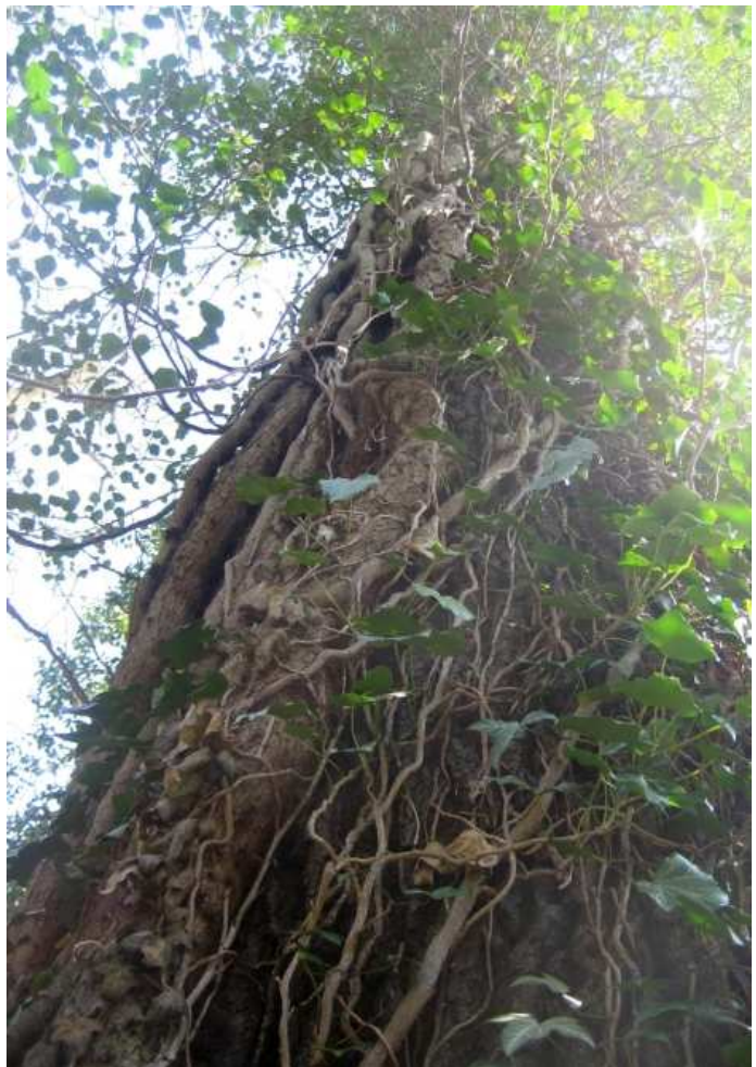
Ein Anblick, der an tropische Wälder erinnert: Mit Efeu bewachsener Eichenstamm am Tiergarten in Hannover

Gelegentlich werden Vermutungen angestellt, dass dichter Efeubewuchs an Stamm und Ästen des Baumes die Rinde von Luft und Licht abschirmt und so beeinträchtigen kann (YAMAN 2009, ALTHAUS 1996). Belege für diese Annahme sind nicht bekannt. 5