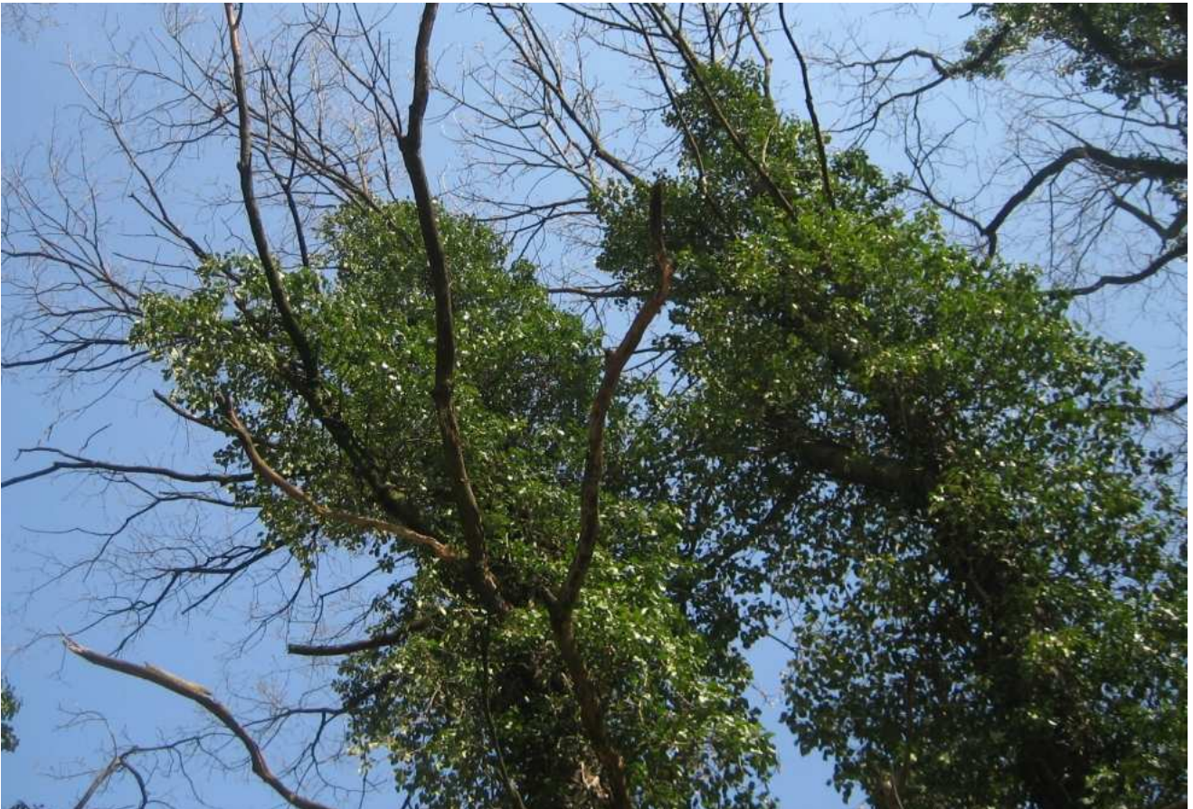
Efeu auf Eichen am Rand des Tiergartens, Hannover