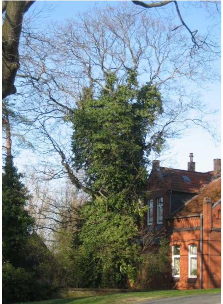
Efeu an einem Berg-Ahorn in Hannover-Limmer. Im winterlichen Zustand ist zu erkennen, dass trotz des kräftigen Bewuchses die für die Assimilation entscheidenden Randbereiche der Krone nicht beschattet werden.

Ob, wie häufig angenommen, Bäume von Efeu überwuchert und somit ausgedunkelt werden können, war Gegenstand einer Studie in dem teilweise seit 30 Jahren unbewirtschafteten Bannwald „Weisweiler Rheinwald“ am Oberrhein. Untersucht wurden 2431 Efeulianen, die in einzelnen Fällen bis zu 50 Jahre alt waren