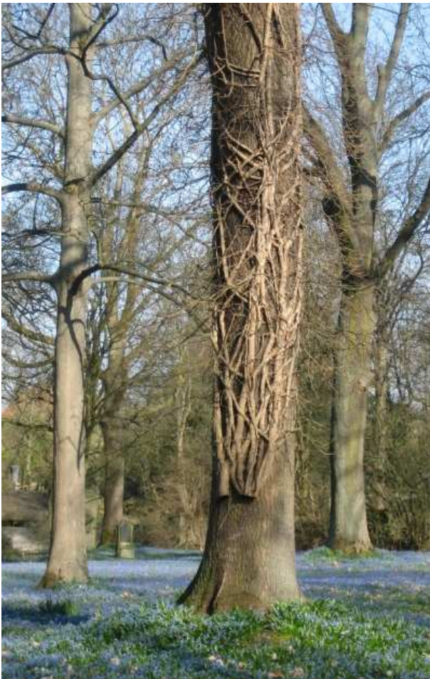
Gekappter Efeu auf dem Stadtfriedhof Lindener Berg, Hannover

Ist der Efeu ( Hedera helix ) in unseren Wäldern und Parks ein freundlicher Klettermaxe oder ein fieser Baumkiller? Mit dieser Frage wurde die BUND-Kreisgruppe Region Hannover in den letzten Jahren immer wieder konfrontiert. Als wir uns während der EXPO-Planungen - mit Unterstützung aus der Politik am Ende erfolgreich - dagegen wandten, dass eine Straße völlig sinnlos durch ein Wäldchen gebaut werden sollte, kam von den Befürwortern dieses Projekts das Argument, dass die Bäume mit Efeu bewachsen und deshalb ohnehin Todeskandidaten seien. Für die Eilenriede und die anderen hannoverschen Stadtwälder forderten einzelne Bürger immer wieder vergeblich, dass die städtischen Förster Efeupflanzen kappen sollen, um die Bäume zu retten. Und bisher unbekannte Efeufeinde halten sich mit Argumenten nicht mehr auf, sondern schneiden