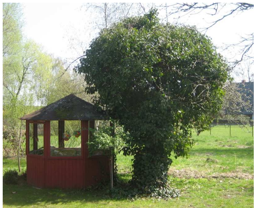
Ein mit Efeu beplanter abgängiger Apfelbaum ist zu einer Bereicherung eines Gartens geworden.

Bei abgängigen und toten Bäumen bietet sich oft eine Efeubepflanzung an, statt die Bäume zu fällen, sofern die Sicherheit gewährleistet ist. Aus dem kränkelnden oder toten Baum kann so