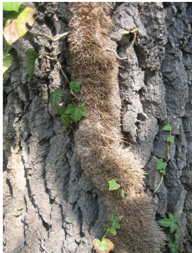
Efeustamm mit Luftwurzeln

Außer den normalen Nährwurzeln im Boden trägt der Efeu Haftwurzeln an den Sprossen. Sie sind aber nicht zur Wasseraufnahme fähig, sondern dienen ausschließlich als Kletterhilfe und können also auch keine anderen Pflanzen